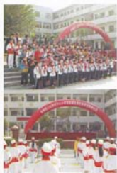
第五届优秀生颁奖