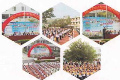
第六届优秀生颁奖