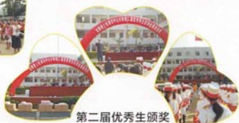
第二届优秀生颁奖